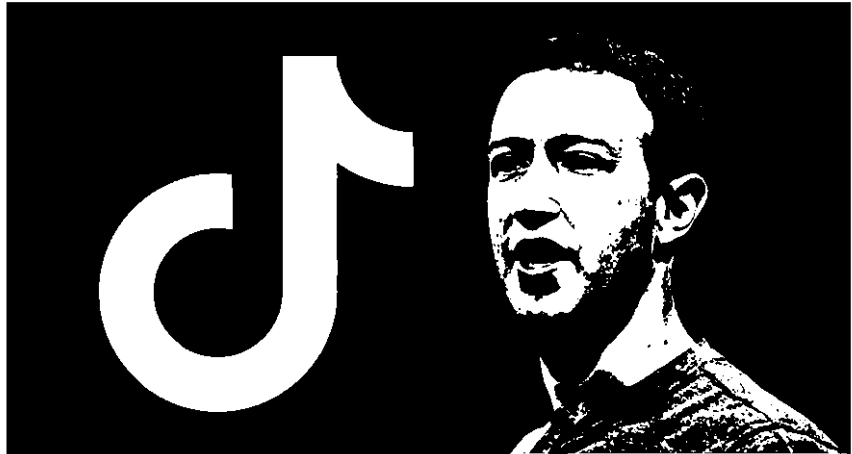
มาร์ก ซักเคอร์เบิร์ก ต้องปวดหัวเพิ่มอีกแล้ว ทนไม่ไหวหนีมาจาก คีโชน

เมื่อวันพุธก่อนผมเพิ่งจะพูดถึง มาร์ก ซักเคอร์เบิร์ก (Mark Zuckerberg) ซีอีโอ และผู้ก่อตั้งเฟซบุ๊ก (Facebook) ไปได้ช่วงนี้คงจะต้องหนักใจและเหนื่อยกายไม่น้อยกับการเป็นตัวตั้งตัวตีให้กับสกุลเงินดิจิทัลลิบร้า (Libra) ที่แม้จะเปิดตัวอย่างยิ่งใหญ่อลังการ แต่ไม่ทันไรก็พบแรงต้านมหาศาลทั้งจากภายนอกโดยสกุลเงินยักษ์ใหญ่ของประเทศต่าง ๆ ทั่วโลก และยังคงความไม่แน่นอนภายในที่บริษัทชั้นนำผู้ร่วมก่อตั้งลิบร้าจำนวนถึง 7 จาก 28 บริษัทพากันประกาศถอนตัวกันไปหมด