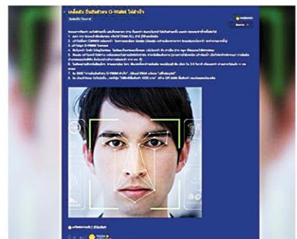
กรณีแนะนำให้เคล็ดการยืนยันตัวตน G-Wallet ให้สำเร็จ