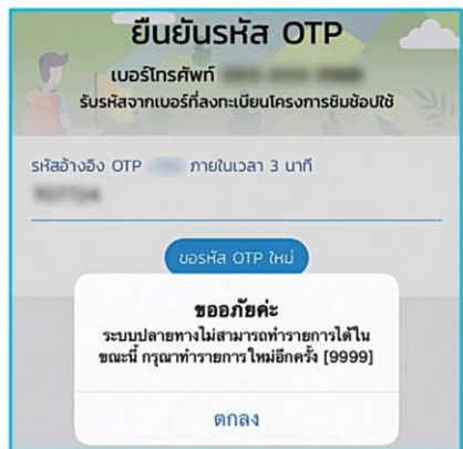
บางคนต้องใช้เวลาลงทะเบียนกว่า 3 ชั่วโมงเลย

แม้จะผ่านด่านแรกของการแข่งกันแย่งสิทธิลงทะเบียนต่อวันไปได้ และมีผลแสดงขึ้นมาหน้าจอบว่าเราลงทะเบียนเสร็จสมบูรณ์แล้ว นั่นไม่ได้แปลว่าเราจะได้รับสิทธิตามมาตรการนี้แล้วนะครับ เพราะต้องรอผลการพิจารณาอีกว่าจะได้หรือไม่ได้ สิทธิ โดยผลการพิจารณาดังกล่าวจะส่งมาให้ผู้ที่ลงทะเบียนสำเร็จภายในระยะเวลาไม่